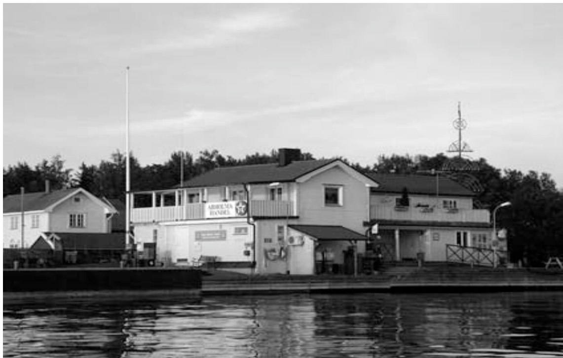
Arholma Handel 2003