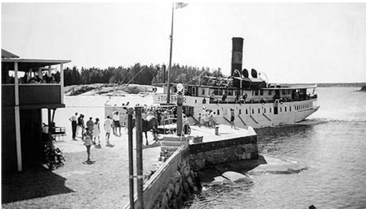
Bild från Arholma Handels storhetstid. Caf et p   verv ningen  r fullsatt, Storsk r ligger inne. Den vackra men l ga stenvuren st r kvar. Den f rsvann vid stormen 1969. Nu ligger resterna bara som en stenh g ut mot sj n dold av den h ga betongmur som finns d r i dag.